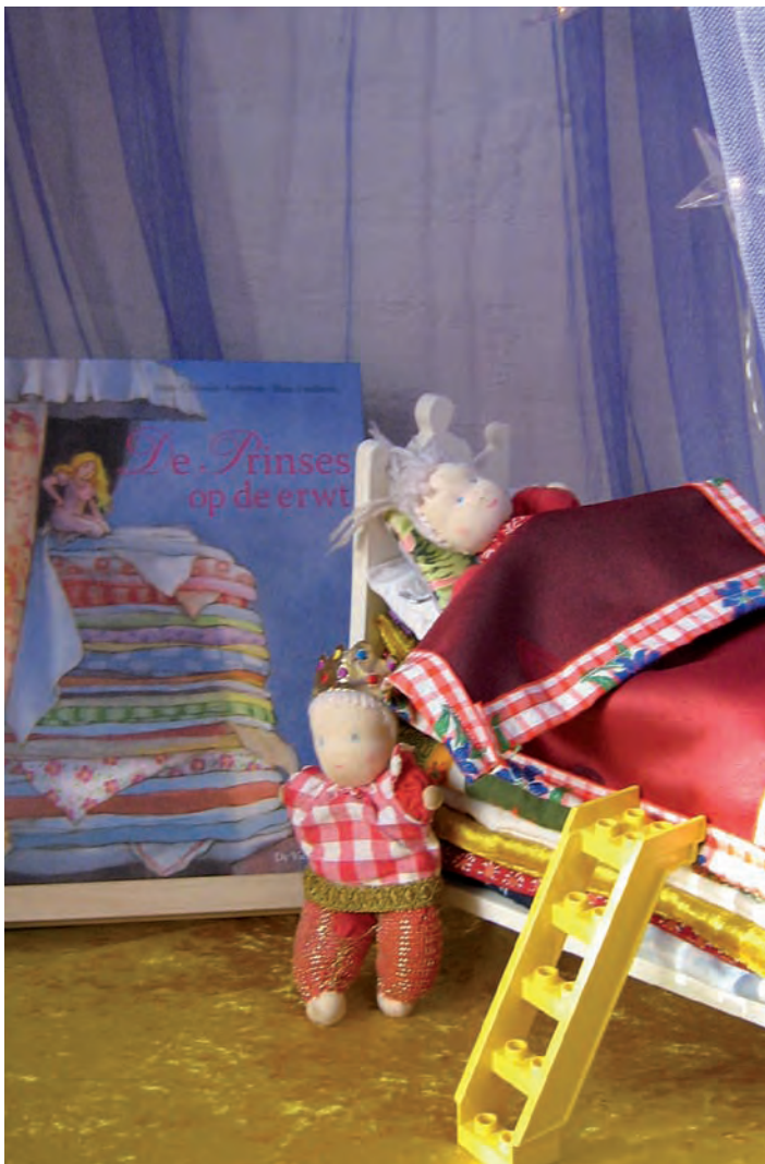
Verhaal Prinses op de erwt

Maar het belangrijkste voor ons zijn de reacties van de kinderen. De fonkel in hun ogen als ze in de klas bezig zijn met een thema.