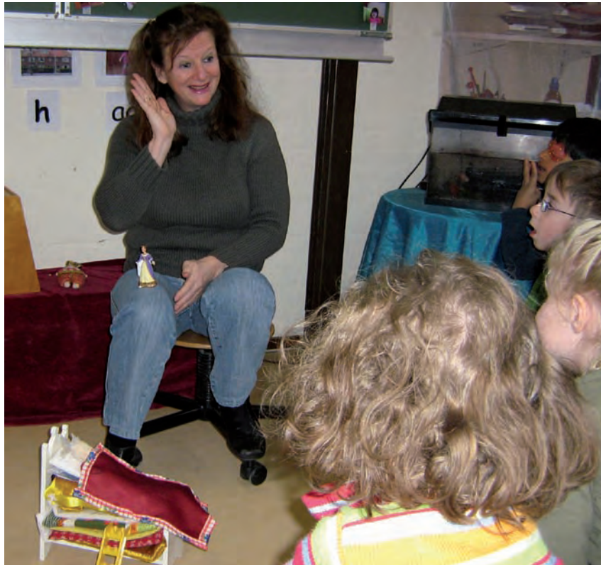
Logopediste ondersteunt met gebaren verhaal Prinses op de erwt